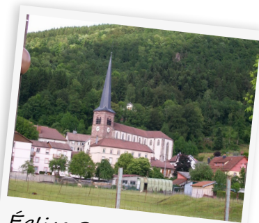
Église Saint-Etienne de Rupt-sur-Moselle